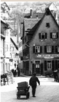
Bahnhofstraße um 1900

Die Lesungen in der Werkstatt der Firma, in der Hermann Hesse 1894/95 sein 14-monatiges Mechanikerpraktikum absolviert hat, feiern in diesem Jahr ihr 10-jähriges Jubiläum. Gelesen wird die Geschichte eines Calwer Lehrlings, dessen Ausbildung nicht so unproblematisch verlief, wie die Hermann Hesses in seiner Perrot-Zeit.