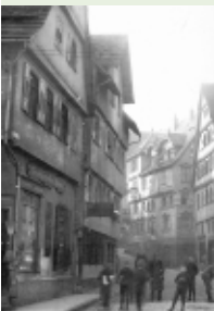
Ecke Lederstraße/ Biergasse