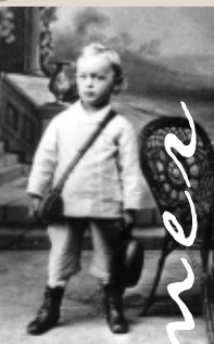
Hermann Hesse im Alter von drei Jahren