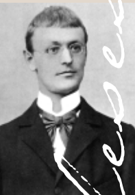
Hermann Hesse, 22-jährig

Im Mittelpunkt stehen die Tagebucheinträge der Mutter über Hermann Hesses Kindheitsjahre sowie eigene Erzählungen. Sie zeigen ein aufgewecktes und manchmal auch trotziges Kind, das seinen ganz eigenen Weg sucht. Die Folkgruppe „Goldvogel“ aus Mannheim wird dazu Vertonungen von Hesse-Gedichten zum Thema Kindheit vortragen.