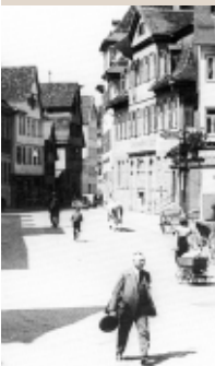
Bischofstraße um 1900

„Die Gerbersauer wandern nicht ungern, und es ist Herkommen, daß ein junger Mensch ein Stück Welt und fremde Sitte sieht, ehe er sich für immer in der Heimat sesshaft macht“, beginnt die Geschichte, in der von den Erfahrungen eines Gerbersauers erzählt wird, der nach vielen Jahren in der Fremde wieder nach Gerbersau zurückkommt.