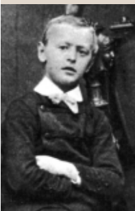
Hermann Hesse, 12-jährig

Gelesen werden eine Liebesgeschichte, die Hermann Hesse vermutlich selbst als Zwölfeinhalbjähriger erlebt hat, sowie die tragisch-komische Geschichte, in der ein etwas schüchterner junger Calwer Kaufmann versucht eine Frau zu finden, damit er die Bedingung erfüllt, die ihm seine Tante gestellt hat für die Übergabe ihres Ladens an ihn.