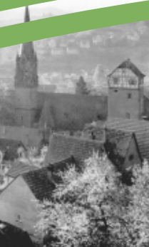
Blick von der Schillerstraße auf Calw