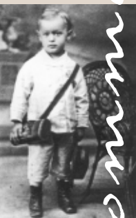
Hermann Hesse im Alter von drei Jahren