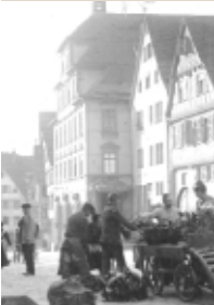
Calwer Marktplatz in früherer Zeit

Im März 1901, als Hermann Hesse bereits als Buchhändler und junger Schriftsteller in Basel lebte, kam er besuchsweise noch einmal einige Tage in sein Elternhaus in der Calwer Bischofstraße. Dort begann er ein „Calwer Tagebuch“ zu schreiben, das im Kern einige Erzählungen über Erlebnisse aus seiner Calwer Jugendzeit enthält, die zum Schönsten gehören, was er über seine Heimatstadt geschrieben hat. Sie waren der Auftakt zu seinen zahlreichen „Gerbersau“-Erzählungen.