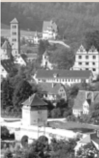
Alte Fotografie vom Kloster Hirsau