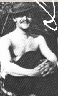
Hermann Hesse in der Gaienhofener Zeit 1906