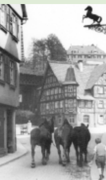
Am „Adlreck“ in früherer Zeit

Die Erzählung „Schön ist die Jugend“ schildert poetisch verarbeitet einen Besuch des gerade beruflich selbstständig gewordenen und mit dem Zug aus Tübingen kommenden Hermann Hesse in seinem Calwer Elternhaus. Er selbst hat sie einmal als die ihm liebste seiner „Gerbersauer Erzählungen“ bezeichnet, da sie Erinnerungen an seine Calwer Zeit „treulich wiedergebe“. Sie zeigt das damalige Leben in der Stadt mit besonders schönem Lokalkolorit.